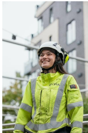
Resultat fra Hafslund Kraft

Resultatandelen fra Hafslund Kraft for årets tre første kvartaler 2025 reduseres noe i forhold til tilsvarende periode i 2024. Oppnådd kraftpris er høyere mens produksjonsvolumet er lavere. Underliggende resultatandel fra Hafslund Kraft for årets tre første kvartaler 2025 ble 987 millioner kroner (923 millioner kroner).