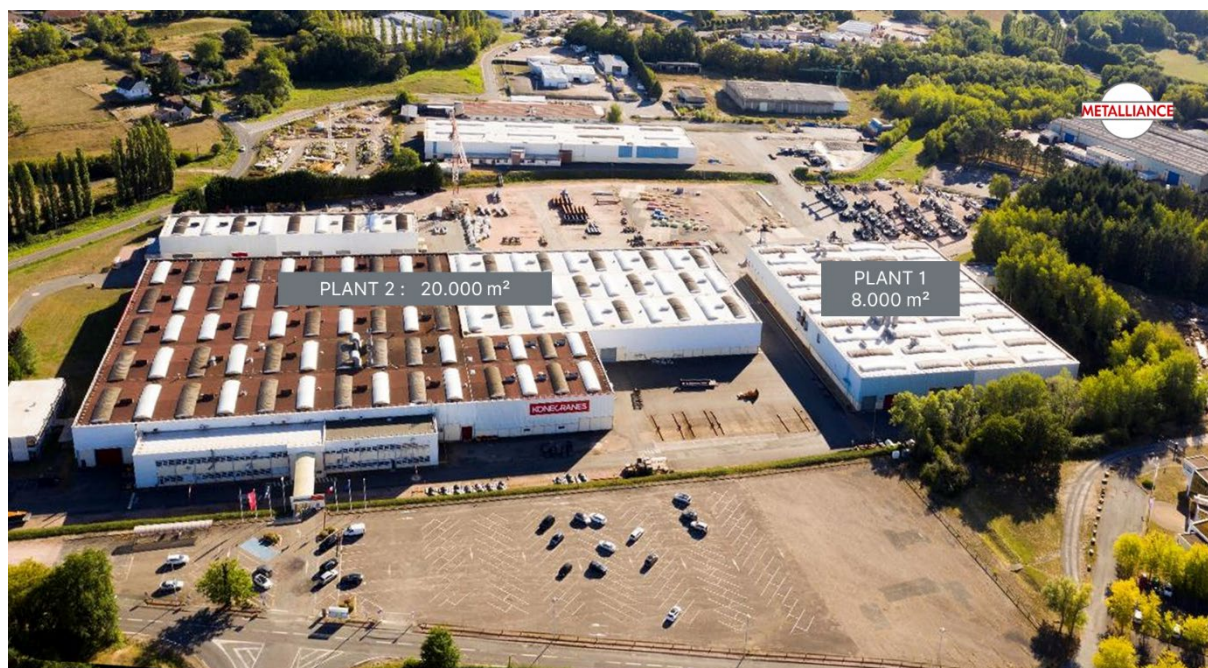
Gaussin | New Plant 13,6 hectares Dedicated to ATM & APM production for European market

GAUSSIN (EURONEXT CROISSANCE ALGAU - FR0013495298), pionnier du transport propre et intelligent dédié aux biens et aux personnes, annonce l'accroissement de ses capacités de production avec l'installation d'un nouveau site de 28 000 m 2 à Saint Vallier, en Saône-et-Loire. Il sera dédié à la production des véhicules ATM® logistique et APM® portuaire afin de répondre à la hausse de la demande sur les marchés européen et américain notamment. Ce nouveau site renforce également l'ancrage territorial historique du Groupe.